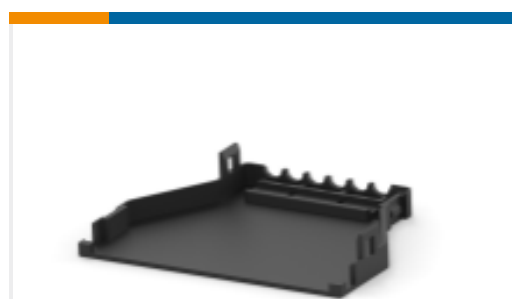
TE 产品编号1776695-1 Strain Relief, D5200, Dynamic