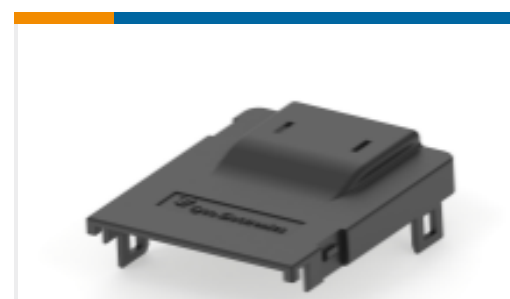
TE 产品编号1986186-1 Strain Relief,20 Posn,D3000 Dynamic, 2