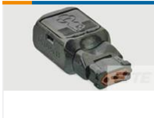
TE 产品编号D369-P33-NS1 369 3 WAY PLUG, CRIMP, SKT