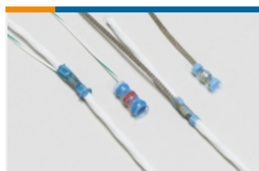
焊接套管屏蔽终结器(11)