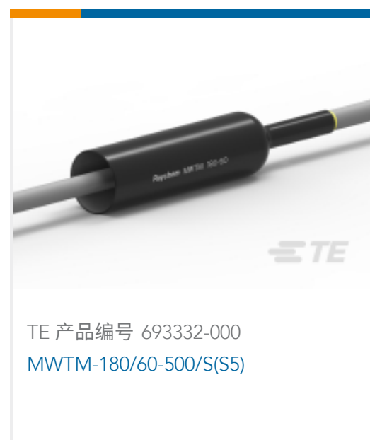
TE 产品编号 693332-000 MWTM-180/60-500/S(S5)