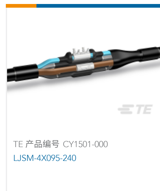
TE 产品编号 CY1501-000 LJSM-4X095-240