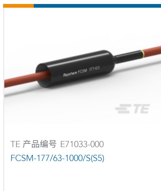
TE 产品编号 E71033-000 FCSM-177/63-1000/S(S5)