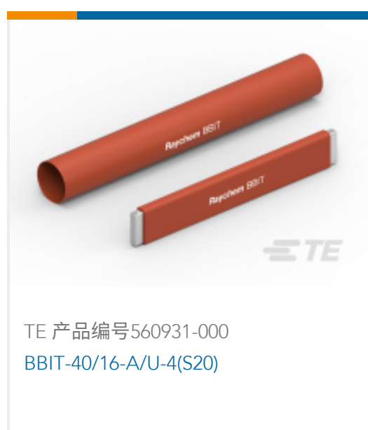
TE 产品编号560931-000 BBIT-40/16-A/U-4(S20)