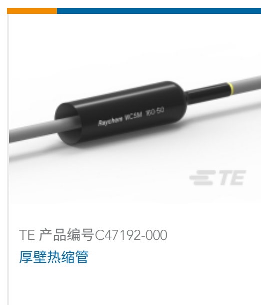
TE 产品编号C47192-000 厚壁热缩管