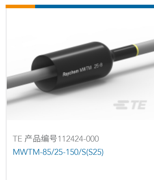
TE 产品编号112424-000 MWTM-85/25-150/S(S25)