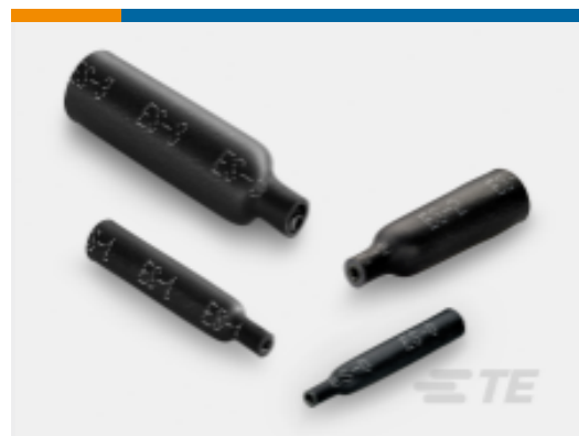
TE 产品编号3371890001 接头密封端盖 (ES 帽)