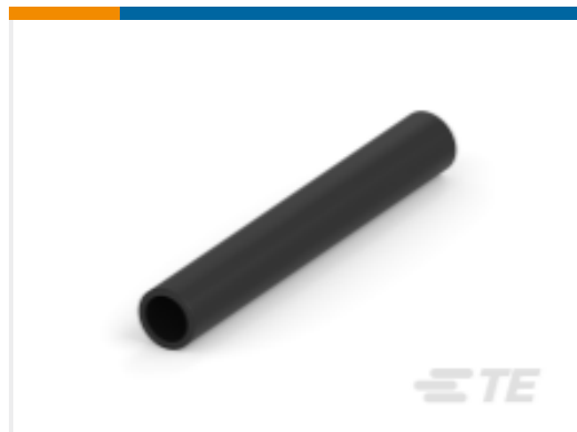
TE 产品编号CB5045-000 BSTS/BSTS-FR 热缩管