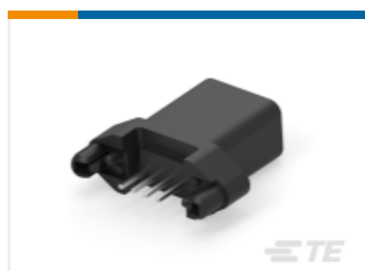
TE 产品编号2-1379700-1 4W TH HEADER ASSY BLACK