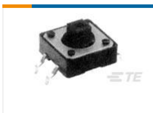
TE 产品编号1571627-1 FSM103A=TACT SWITCH,260G