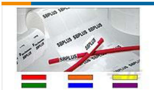
TE 产品编号CN9928-000 SBP100594WE1