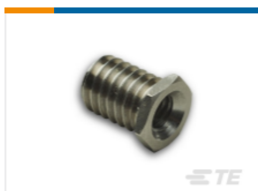
TE 产品编号1-2186516-1 T3200-PRINTER-CUT/PERF- ADDAPTOR