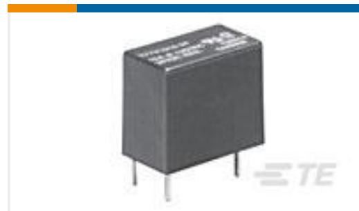
TE 产品编号1-1393194-5 T77S1D3-12