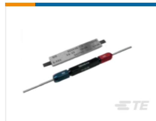
TE 产品编号525443-6 PLUG GAUGE, HANDTOOL