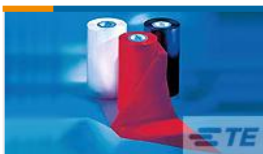
TE 产品编号754073-000 TMS-RJS-RIBBON-4HT