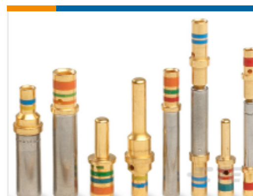
TE 产品编号0641-1-2031L CONT PIN