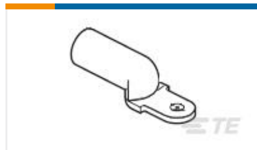
TE 产品编号277148-7 TERM,SLD COPALUM R 6 1/4