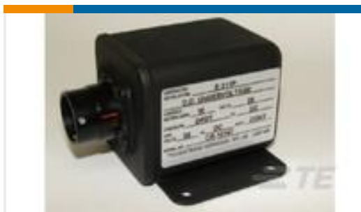
TE 产品编号1-1616126-0 E311P=RELAY