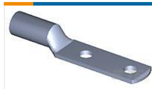
TE 产品编号55837-1 COPALUM R 1/0A 2C (2)3/8