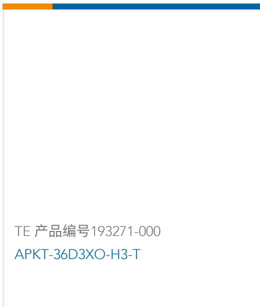
TE 产品编号193271-000 APKT-36D3XO-H3-T