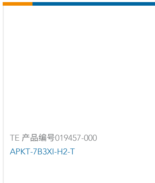
TE 产品编号019457-000 APKT-7B3XI-H2-T