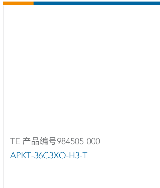
TE 产品编号984505-000 APKT-36C3XO-H3-T