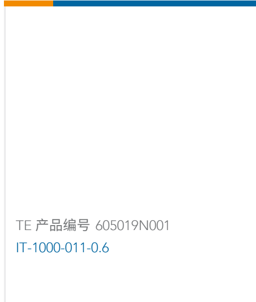
TE 产品编号 605019N001 IT-1000-011-0.6