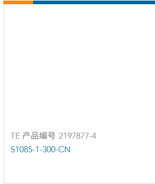
TE 产品编号 2197877-4 S1085-1-300-CN