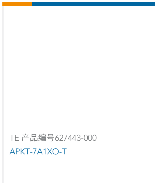
TE 产品编号627443-000 APKT-7A1XO-T