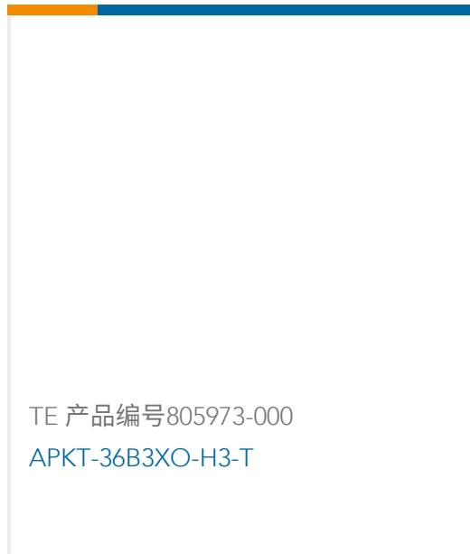
TE 产品编号805973-000 APKT-36B3XO-H3-T