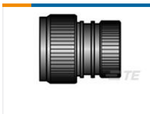
TE 产品编号527781-000 HEX40-AC-00-15-A5-1