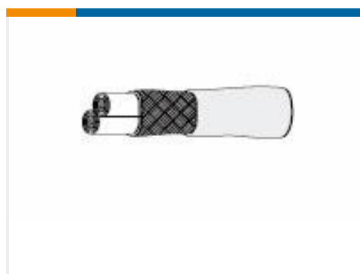
TE 产品编号272103-000 55A1123-20-9/96-9CS2275