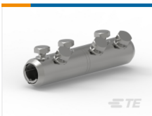
TE 产品编号1099848-1 ASBS-600-1000