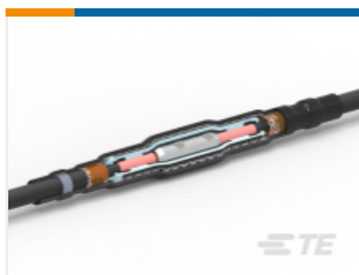
TE 产品编号EA7549-000 CSJA-JCN/EG-3515M10