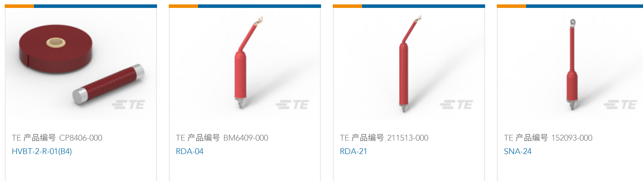
TE 产品编号 CP8406-000 HVBT-2-R-01(B4)