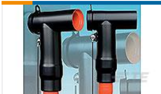
TE 产品编号CR6078-000 RSTI-6952