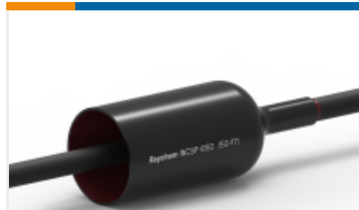
TE 产品编号764220-000 核厚壁热缩管