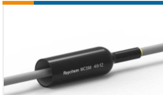
TE 产品编号CU8546-000 WCSM-48/12-1200/S