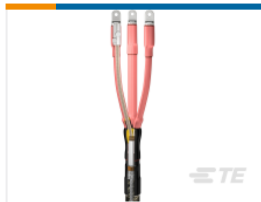
TE 产品编号A31452-070 GUST-12/70-120/800-L12