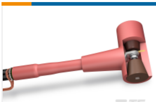
TE 产品编号555340-070 RICS-5123