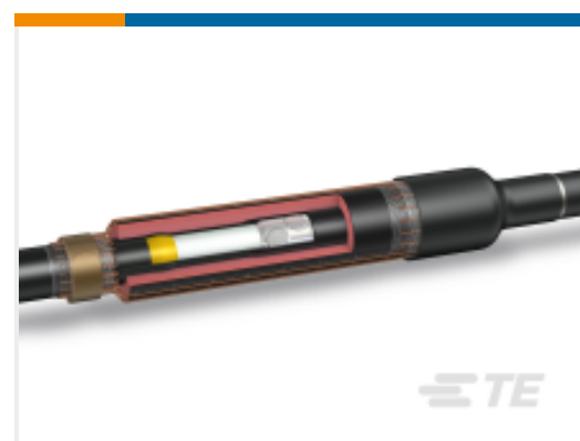
TE 产品编号 E67139-069 POLJ-24/1X120-240