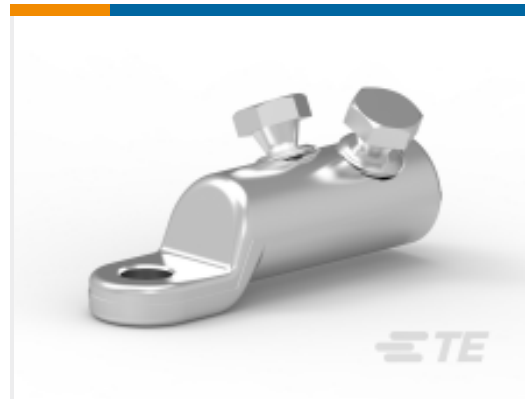
TE 产品编号 CAT-BLMT 电压等级高达 84 kV 的力矩螺栓连接器