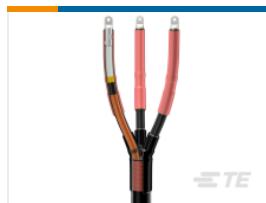
TE 产品编号 E92435-063 POLT-12D/3XIH1