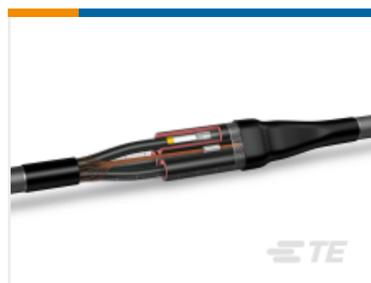
TE 产品编号 D11309-070 POLJ-12/3X25-70