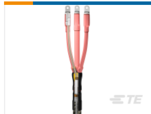
TE 产品编号 A31452-070 GUST-12/70-120/800-L12