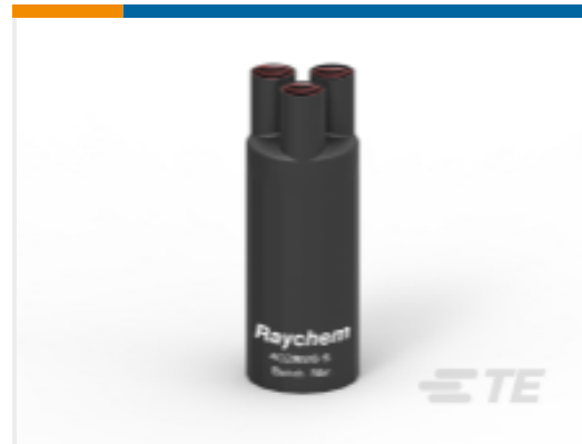
TE 产品编号 CAT-CABLE-BREAKOUT Heat Shrink Halogen-Free Cable Breakout Boots