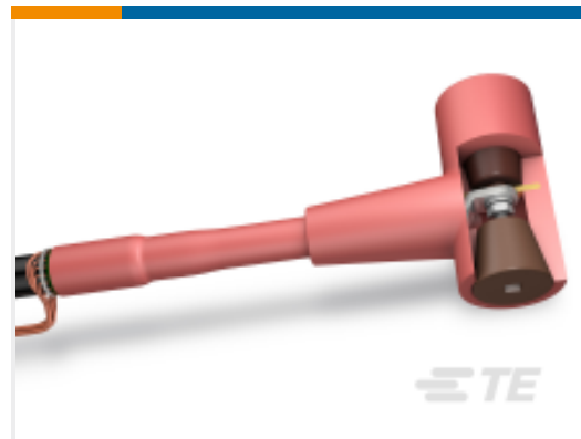
TE 产品编号 555340-070 RICS-5123