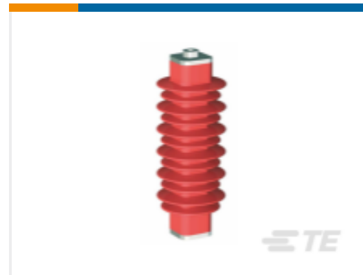
TE 产品编号 EN6028-000 HDA-33M-B3-NFF