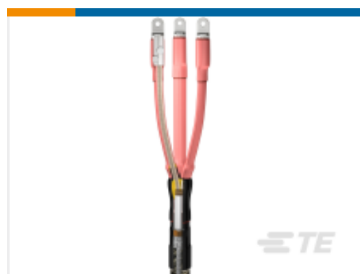
TE 产品编号 C47372-064 GUST-12/25-50/800