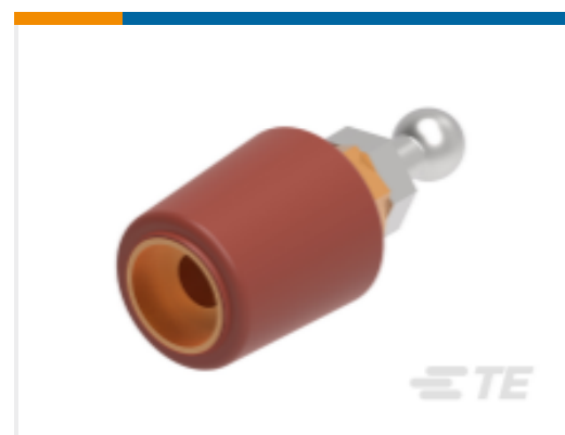
TE 产品编号 CS8406-011 RSTI-68EA20