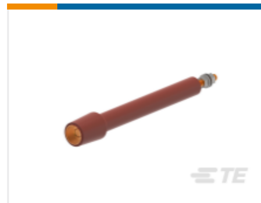
TE 产品编号 CN9357-011 RSTI-68TR