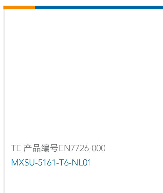
TE 产品编号EN7726-000 MXSU-5161-T6-NL01