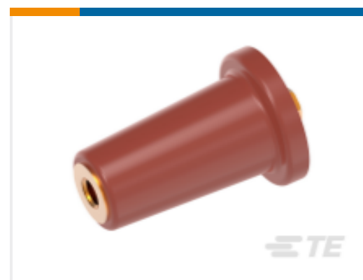
TE 产品编号 CS9958-000 RSTI-68TP