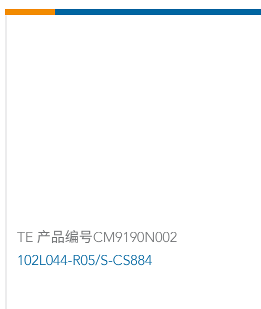
TE 产品编号CM9190N002 102L044-R05/S-CS884