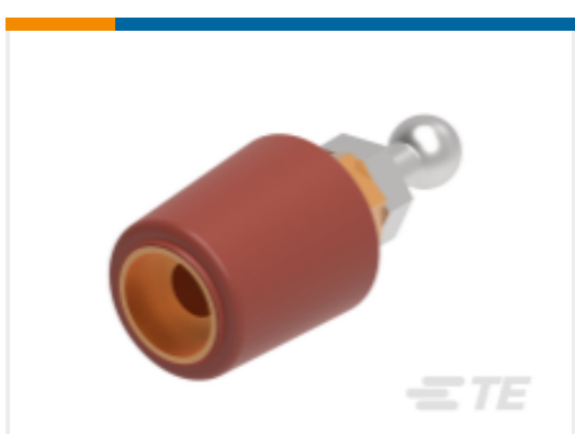
TE 产品编号 CS8406-011 RSTI-68EA20