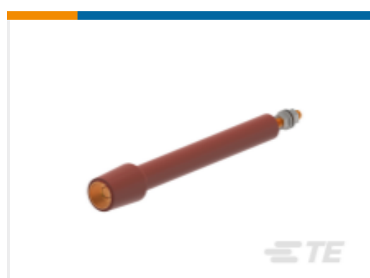
TE 产品编号 CN9357-011 RSTI-68TR