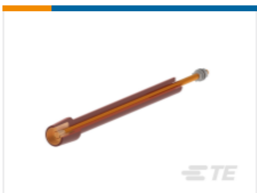
TE 产品编号 CN9356-011 RSTI-68TRL