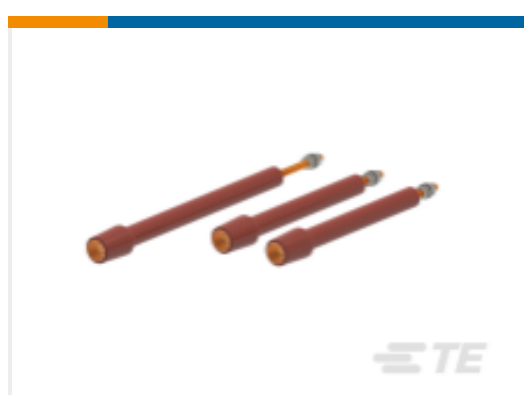
TE 产品编号 CN9358-011 RSTI-68TRA