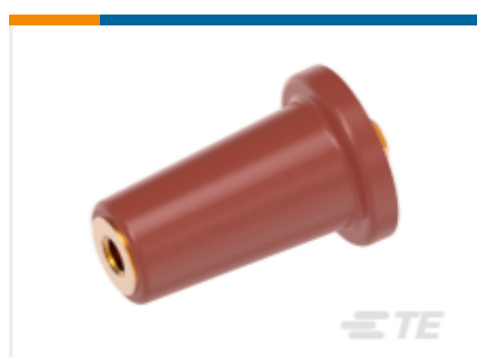
TE 产品编号 CS9958-000 RSTI-68TP