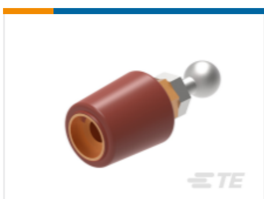
TE 产品编号 CS8405-011 RSTI-68EA25