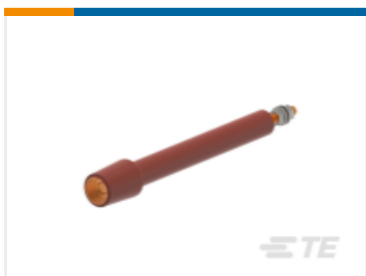
TE 产品编号 CM9732-000 RSTI-68TR-310