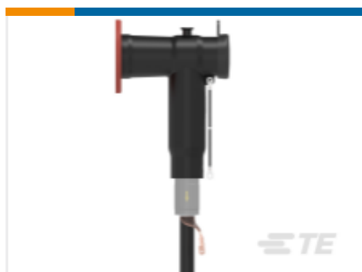
TE 产品编号 ER6938-011 ELBC-5855