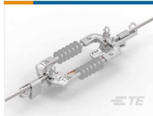
TE 产品编号1710737-4 69kILD-KR9C-w/T-450-500