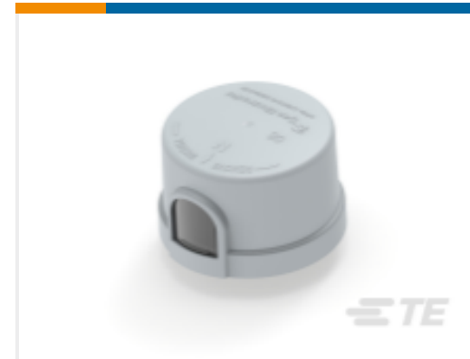
TE 产品编号965316-000 ALR-2060-NPS