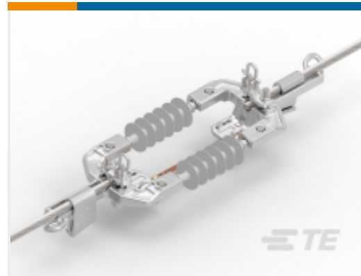
TE 产品编号1710726-3 29kILD-L-FRAME-KS9C