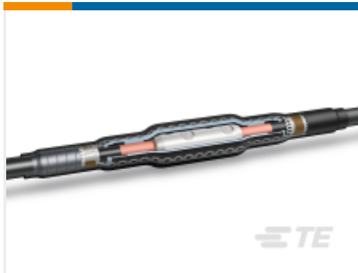
TE 产品编号CF9550-000 直插式接头：冷收缩，15-35 kV