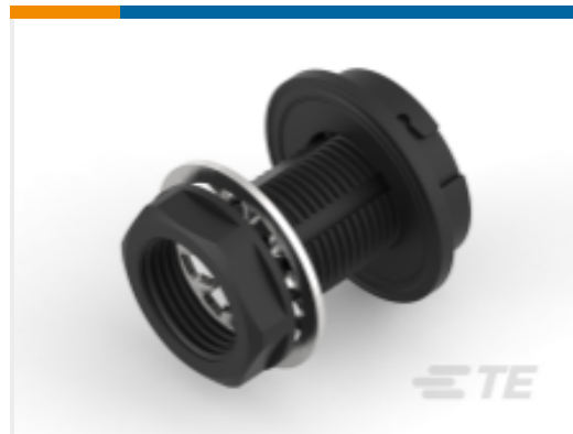
TE 产品编号2213858-1 RECEPTACLE ASSEM., LUMAWISE ENDURANCE S