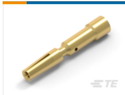
TE 产品编号60-0011-011-000 CONTACT SOCKET 1 MM