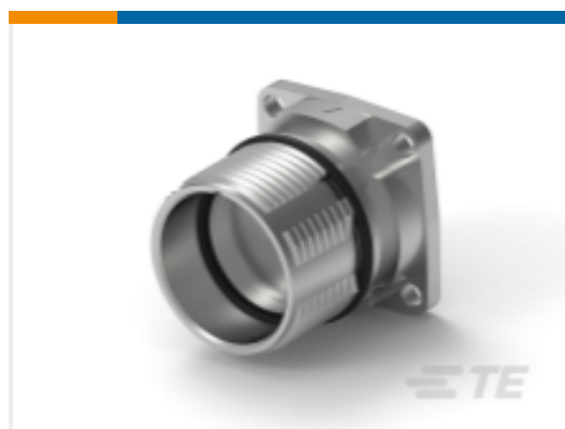
TE 产品编号AEA000N00000201000 623 RECEPTACLE, SPEEDTEC-READY