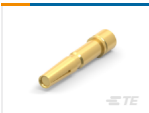
TE 产品编号60-0070-011-000 CONTACT SOCKET 1,5 MM