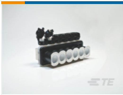
TE 产品编号A36977-000 GPRT-350-8P(B6)