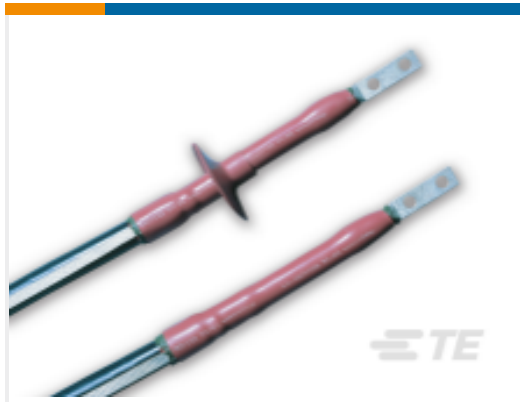
TE 产品编号F59451-000 HVT-Z-252/352-SG