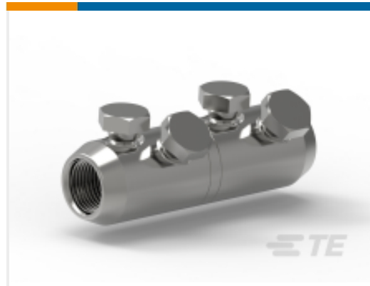
TE 产品编号1974139-1 ASBS-250-350-U