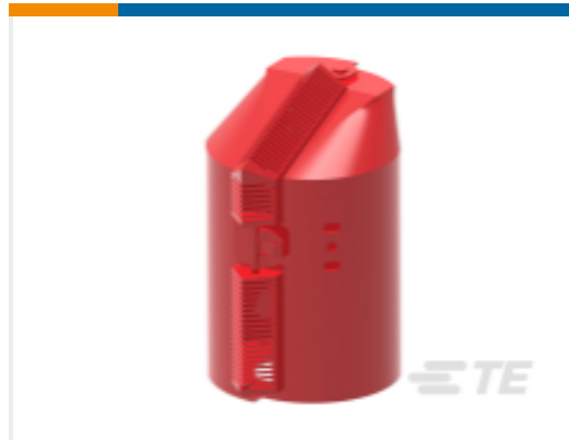
TE 产品编号901284-000 BCAC-5D/8-01(B12)