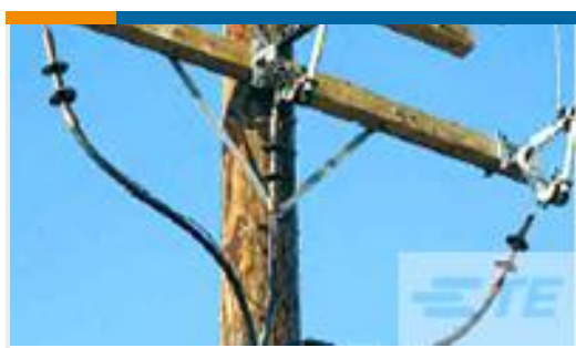
TE 产品编号476155-000 HVT-151-SJ