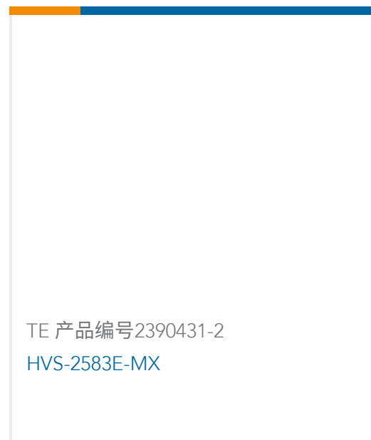
TE 产品编号2390431-2 HVS-2583E-MX