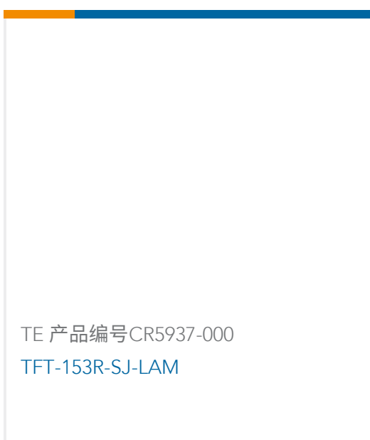
TE 产品编号CR5937-000 TFT-153R-SJ-LAM