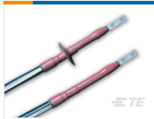
TE 产品编号CB2514-000 HVT-Z-154-SJ