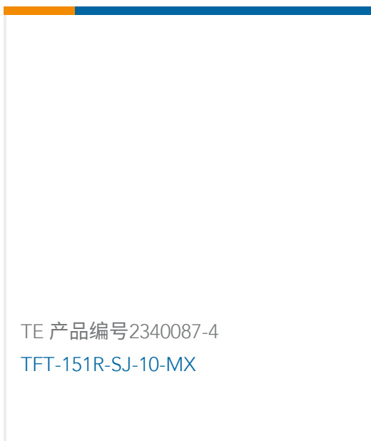
TE 产品编号2340087-4 TFT-151R-SJ-10-MX