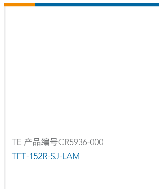
TE 产品编号CR5936-000 TFT-152R-SJ-LAM