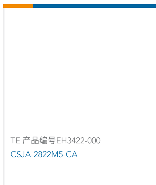
TE 产品编号EH3422-000 CSJA-2822M5-CA