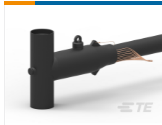
TE 产品编号ED0516-000 ELB-35-600-CP-AL