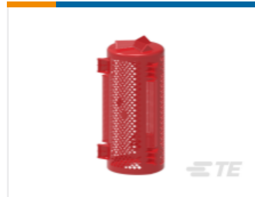
TE 产品编号CS7744-000 BCAC-IC-7D/12(B6)