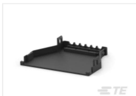
TE 产品编号 1776695-1 Strain Relief, D5200, Dynamic