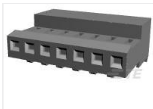
TE 产品编号3-644426-7 07P MTA100 CONN ASSY W/O#5