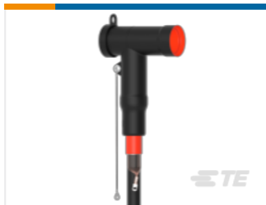
TE 产品编号CR5012-011 屏蔽式可分离连接器 1250 A