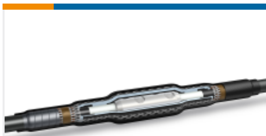
TE 产品编号CJ9887-011 Inline Joint: Cold Shrink, Straight up to 42 kV