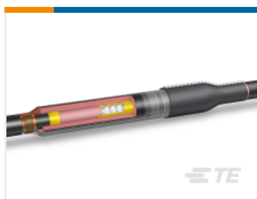
TE 产品编号CL7586-000 HVS-C-1523S