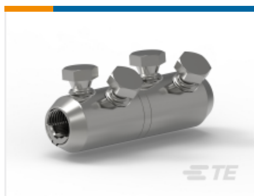
TE 产品编号1974130-1 修剪螺栓连接器高达 35 kV