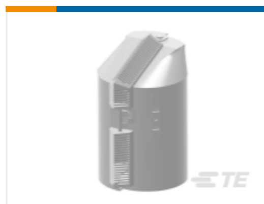
TE 产品编号A90301-000 BCAC-G-5D/8-01(B12)