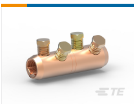
TE 产品编号1974102-1 CSBS-300-750