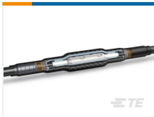
TE 产品编号CL1171-011 CSJA 直接头