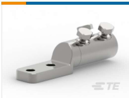
TE 产品编号1099369-1 ASBT 350-750