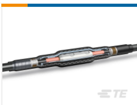
TE 产品编号2133407-1 CSJA-36D/1XU-1XU-M-BR