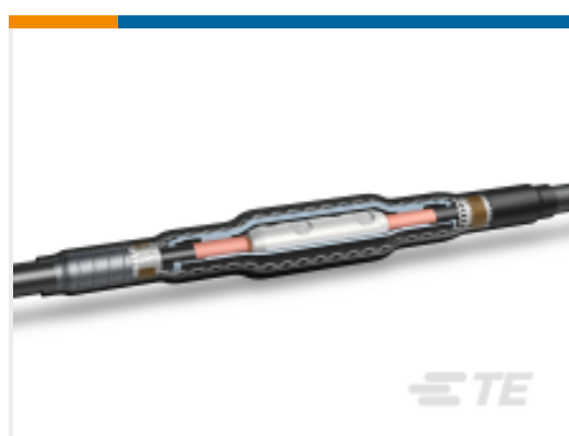
TE 产品编号2133407-5 CSJA-36E/1XU-1XU-M1-BR