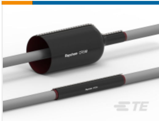
TE 产品编号002611-000 CRSM-143/36-1000/239(S1)