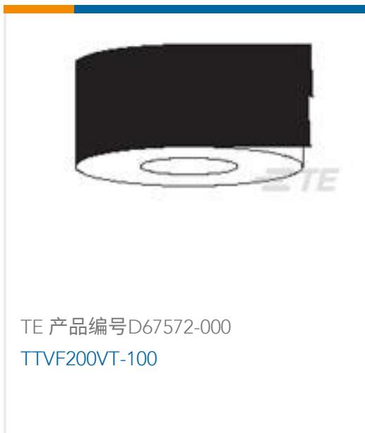
TE 产品编号D67572-000 TTVF200VT-100