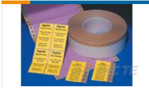
TE 产品编号160892-000 TTVF100WE-100