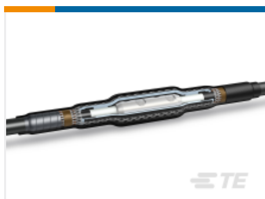
TE 产品编号CJ9877-011 CSJA-24D/1XU-1XU-M