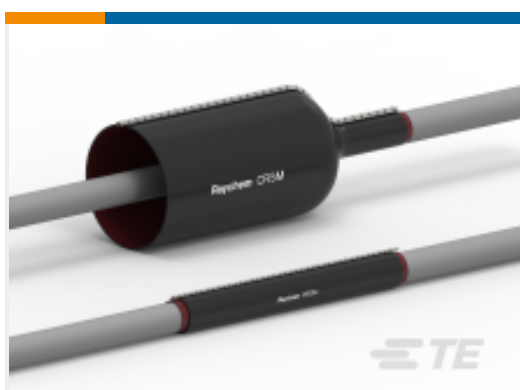
TE 产品编号002611-000 CRSM-143/36-1000/239(S1)