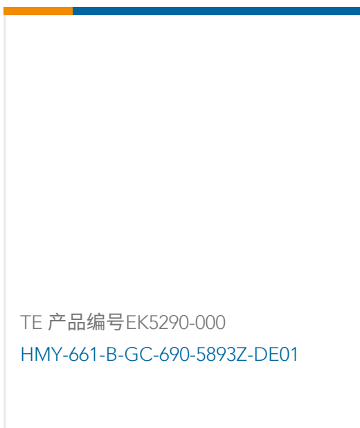
TE 产品编号EK5290-000 HMY-661-B-GC-690-5893Z-DE01