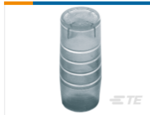
TE 产品编号096456-000 GURO-CEC-23/30