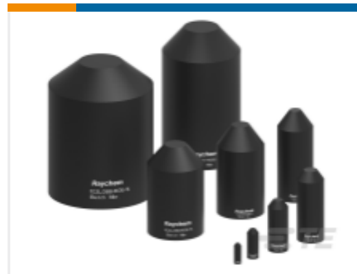
TE 产品编号F33327N001 102C025/244(S10)