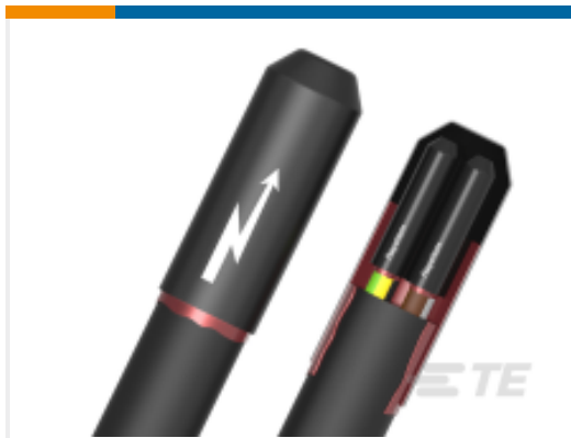
TE 产品编号141385-000 EPKE-0024-DE01(S25)