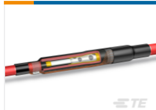
TE 产品编号CN7183-005 MXSU-3131-T2