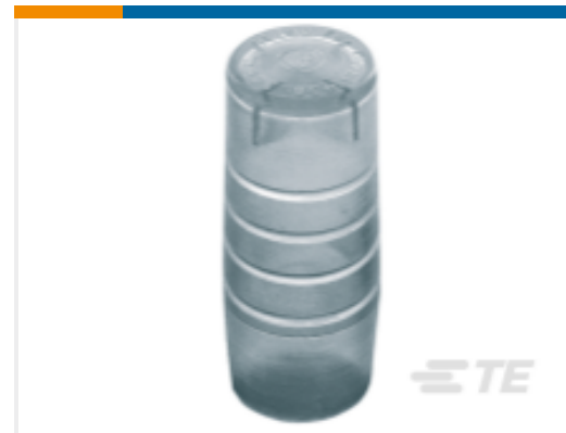
TE 产品编号890196-000 GURO-CEC-16/22