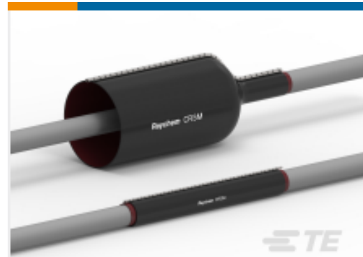
TE 产品编号790949-000 CRSM-250/98-1500/239(S1)