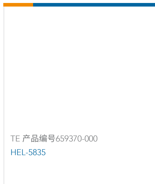
TE 产品编号659370-000 HEL-5835