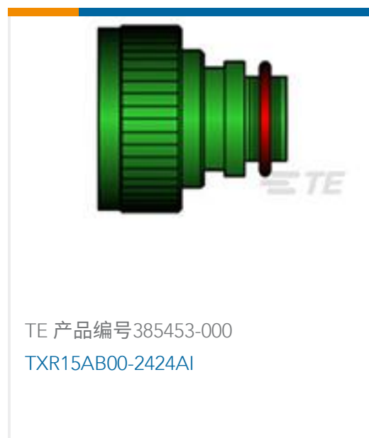
TE 产品编号385453-000 TXR15AB00-2424AI