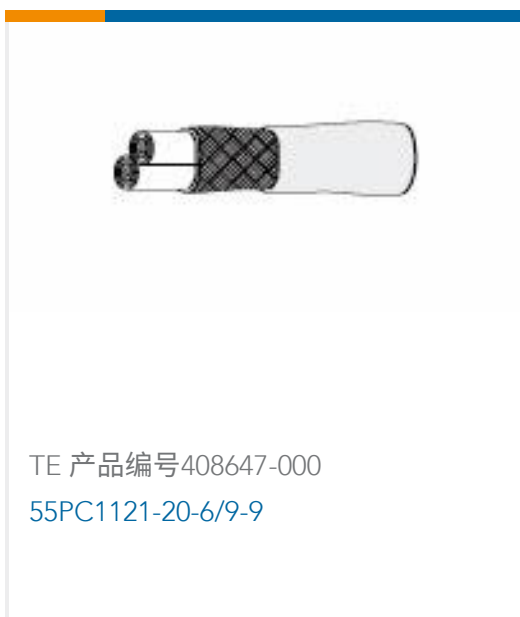
TE 产品编号408647-000 55PC1121-20-6/9-9