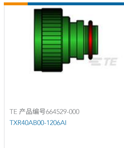
TE 产品编号664529-000 TXR40AB00-1206AI