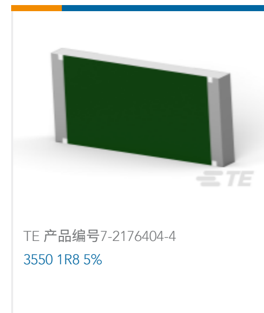
TE 产品编号7-2176404-4 3550 1R8 5%