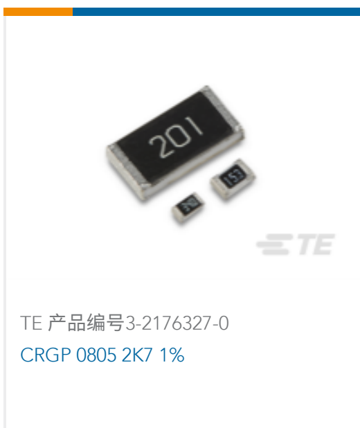
TE 产品编号3-2176327-0 CRGP 0805 2K7 1%