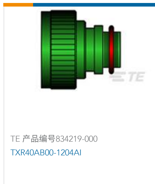
TE 产品编号834219-000 TXR40AB00-1204AI