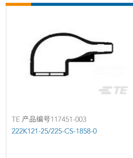
TE 产品编号117451-003 222K121-25/225-CS-1858-0