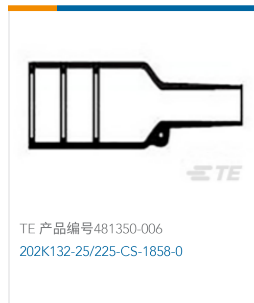
TE 产品编号481350-006 202K132-25/225-CS-1858-0