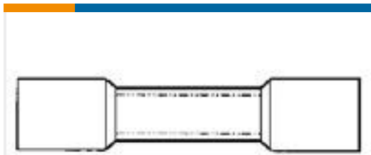
TE 产品编号55845-1 #8 PRE-INSUL SEALED SPLICE