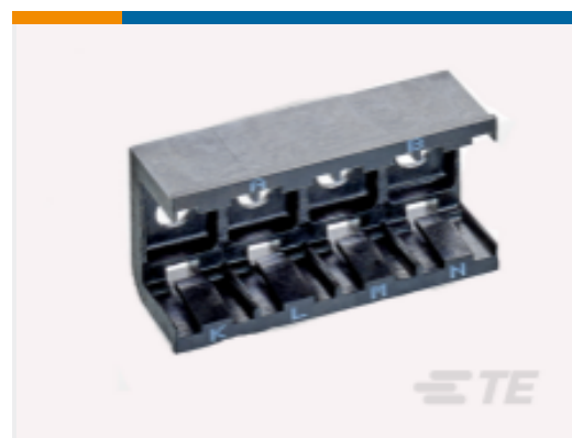
TE 产品编号DCR-1A-06 COMPOSIT RAIL