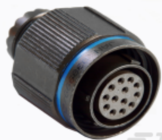
TE 产品编号YDTS26W13-98SBC001 PLUG ASSY