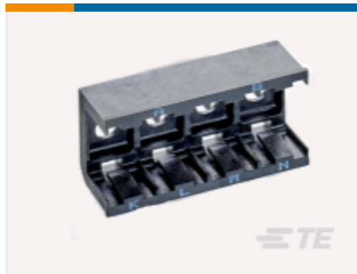
TE 产品编号DCR-1A-06 COMPOSIT RAIL