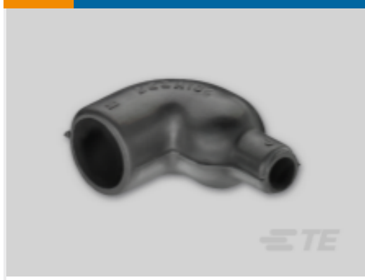
TE 产品编号806823-000 球形热缩护套：有嘴，直角