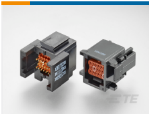
TE 产品编号ABC06N-22P IN-LINE PLUG