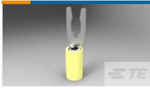
TE 产品编号52430-3 TERMINAL,PIDG SPR SPD 12-10 6