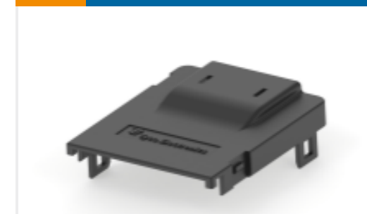
TE 产品编号1986186-1 Strain Relief,20 Posn,D3000 Dynamic, 2