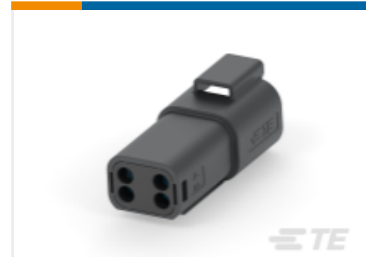
TE 产品编号1-2600030-0 4CCT BLACK RECEPT W/LARGE SEAL