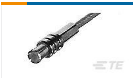
TE 产品编号1060875-2 MCX CABLE PLUG, CRIMP ATTACH