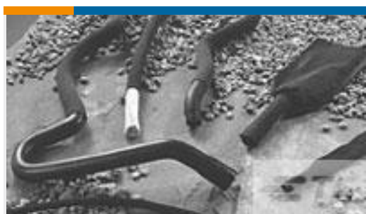
TE 产品编号CH37246001 HFT5000-50/25-0-245MM