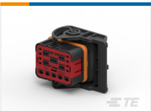
TE 产品编号5-2208775-8 53POS, MIXED,REC HSG,ASSY, SEALED