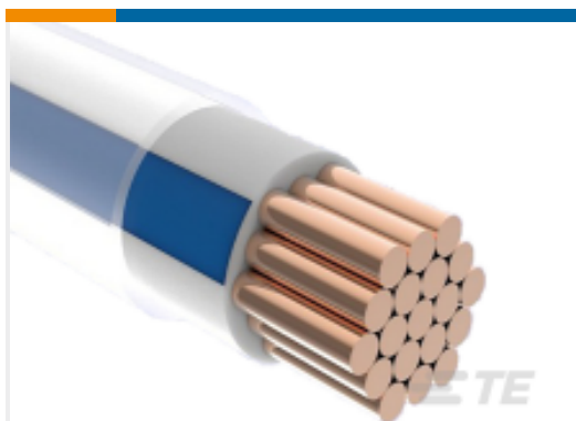
TE 产品编号CD20873001 ACW0219-1.50-12L(NS)