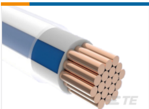
TE 产品编号CT01383001 ACW0219-1.00-12L(NS)