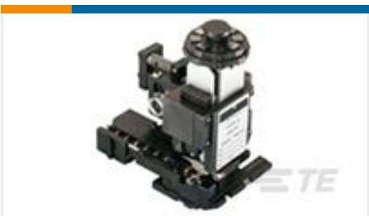
TE 产品编号1855666-6 HDM/FA SAPR .180F.250F LM CONT 001-0294