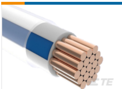
TE 产品编号CD20813001 ACW0219-1.00-74(NS)