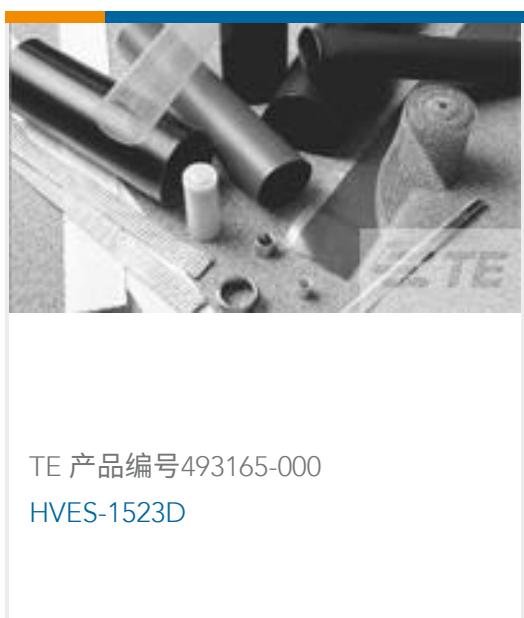
TE 产品编号493165-000 HVES-1523D