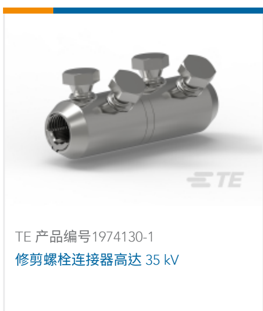
TE 产品编号1974130-1 修剪螺栓连接器高达 35 kV