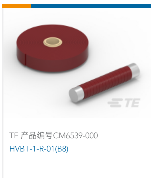
TE 产品编号CM6539-000 HVBT-1-R-01(B8)