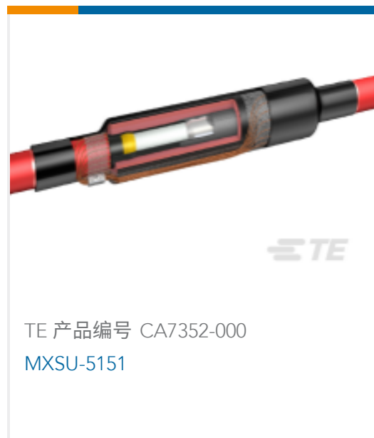
TE 产品编号 CA7352-000 MXSU-5151