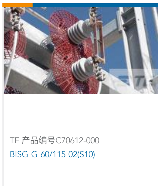
TE 产品编号C70612-000 BISG-G-60/115-02(S10)