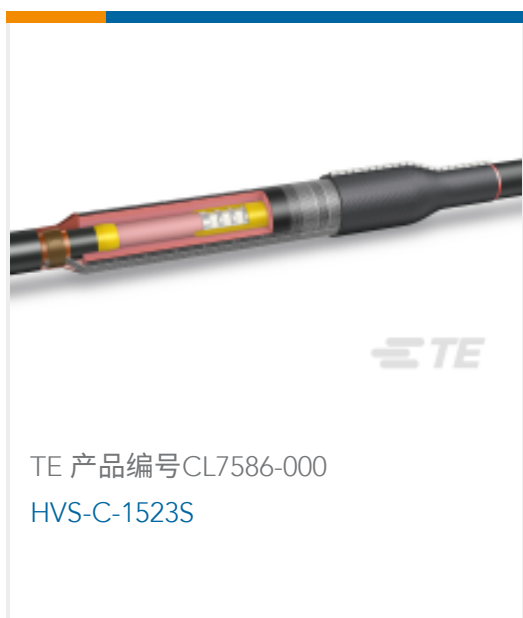
TE 产品编号CL7586-000 HVS-C-1523S