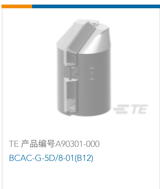
TE 产品编号A90301-000 BCAC-G-5D/8-01(B12)