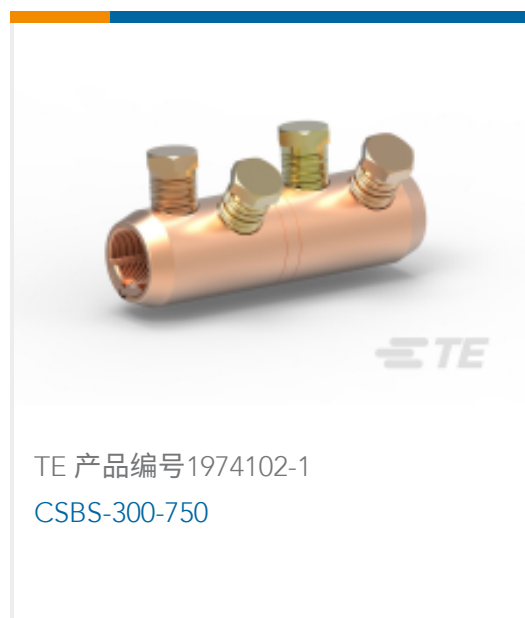
TE 产品编号1974102-1 CSBS-300-750