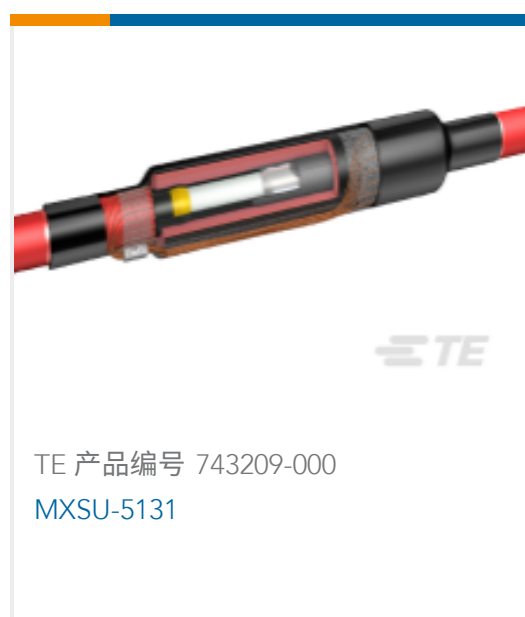
TE 产品编号 743209-000 MXSU-5131