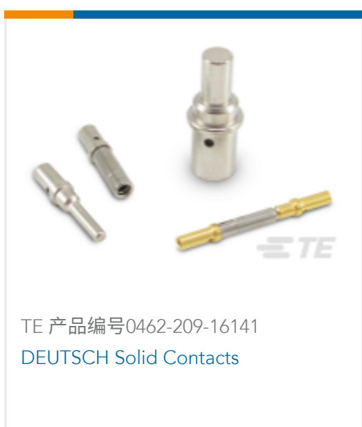
TE 产品编号0462-209-16141 DEUTSCH Solid Contacts