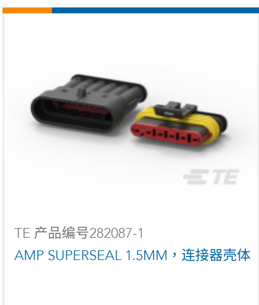
TE 产品编号282087-1 AMP SUPERSEAL 1.5MM, 连接器壳体