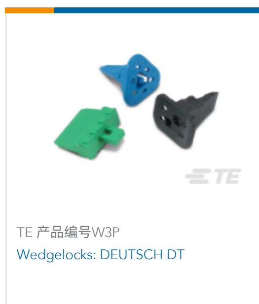
TE 产品编号W3P Wedgelocks: DEUTSCH DT