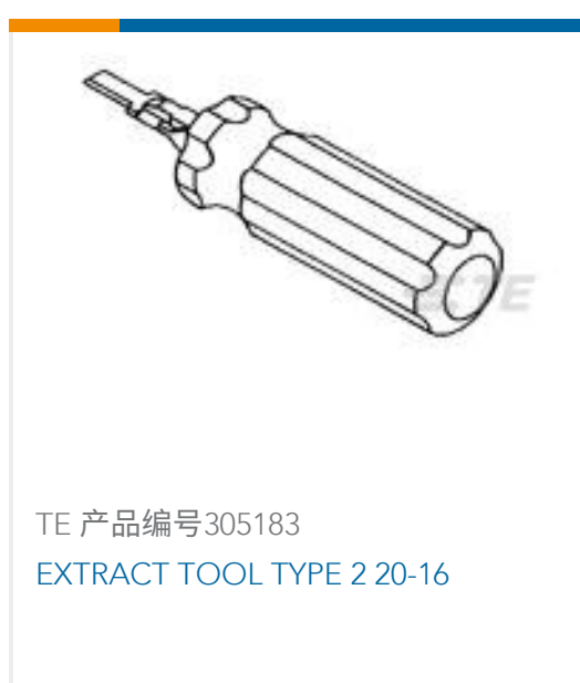
TE 产品编号305183 EXTRACT TOOL TYPE 2 20-16