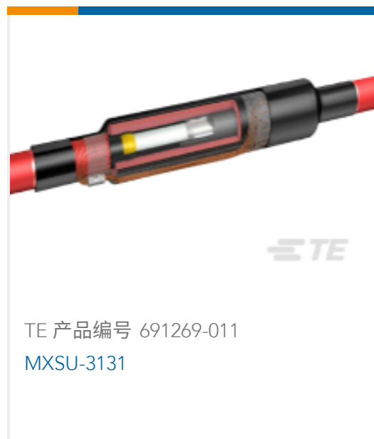
TE 产品编号 691269-011 MXSU-3131