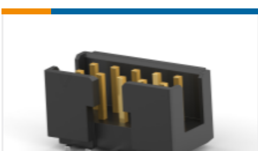
TE 产品编号1-2373376-0 10P,2MM,SHRD HDR,DRVVT,SMD,0.1 AU,TB