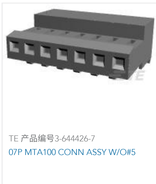
TE 产品编号3-644426-7 07P MTA100 CONN ASSY W/O#5