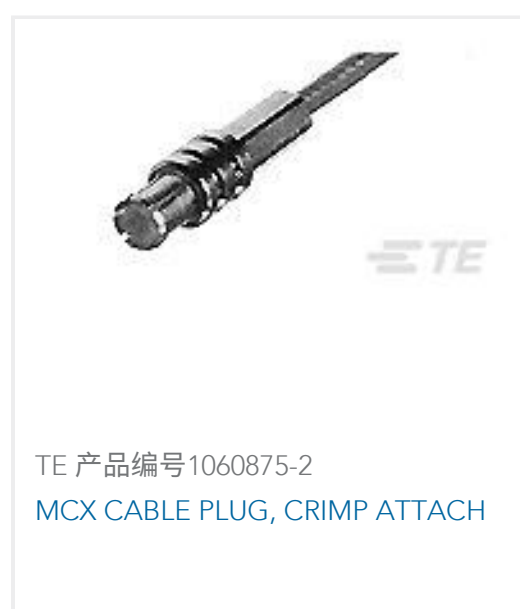
TE 产品编号1060875-2 MCX CABLE PLUG, CRIMP ATTACH