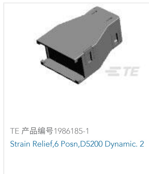
TE 产品编号1986185-1 Strain Relief,6 Posn,D5200 Dynamic, 2