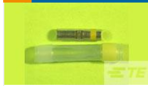
TE 产品编号650110-000 D-436-0128