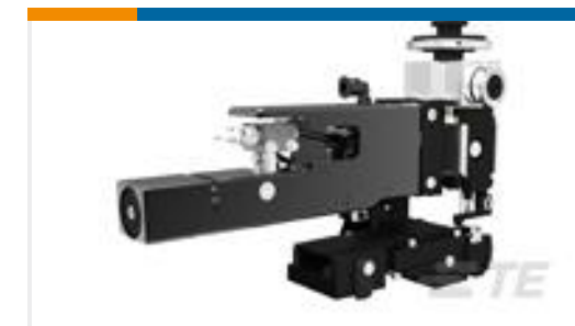
TE 产品编号 2151609-2 OCEAN_2.0_APPLICATIONER-S-079F1950