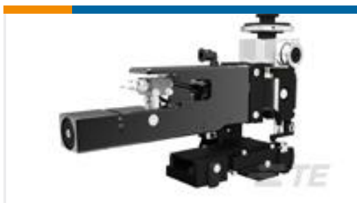
TE 产品编号 2151854-2 OCEAN_2.0_APPLICATIONER-S-070F1000A