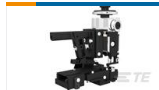
TE 产品编号 2151579-1 OCEAN_2.0_APPLICATIONER-S-120F1550