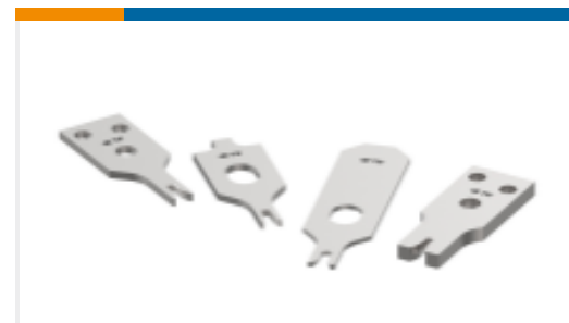
CRIMPER REPRESENTATION ONLY