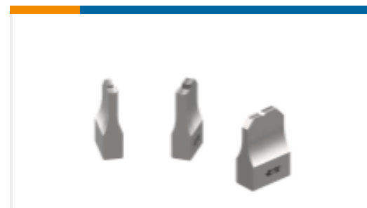
ANVIL REPRESENTATION ONLY