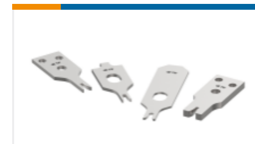
CRIMPER REPRESENTATION ONLY