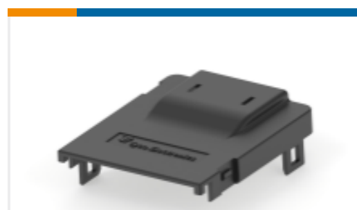
TE 产品编号1986186-1 Strain Relief,20 Posn,D3000 Dynamic, 2