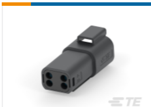
TE 产品编号1-2600030-0 4CCT BLACK RECEP W/LARGE SEAL