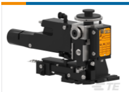
TE 产品编号2266528-2 OCEAN_2.0_APPLICATION-S- 120F126OV-RSA