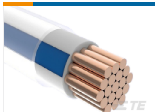
TE 产品编号CD20873001 ACW0219-1.50-12L(NS)