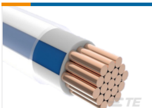
TE 产品编号CT01383001 ACW0219-1.00-12L(NS)