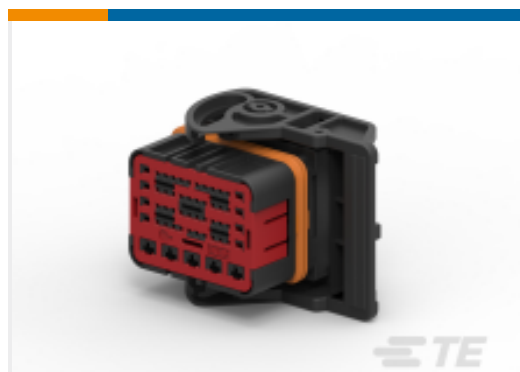
TE 产品编号5-2208775-8 53POS, MIXED,REC HSG,ASSY, SEALED