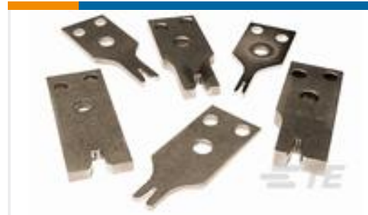
TE 产品编号1-856313-3 CRIMPER,WIRE