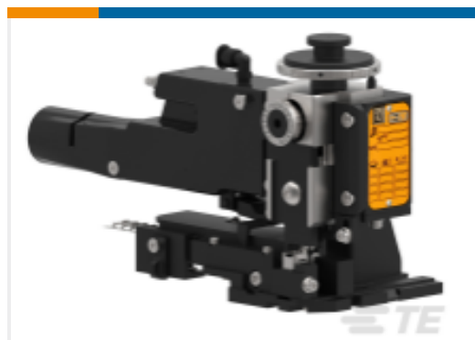
TE 产品编号2266531-2 OCEAN_2.0_Application-S-079F118OV- RSA