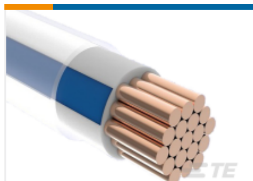
TE 产品编号CD20813001 ACW0219-1.00-74(NS)