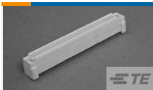
TE 产品编号3-5177986-1 0.8FH,P08H.5,040,08/Sn,TR,SC