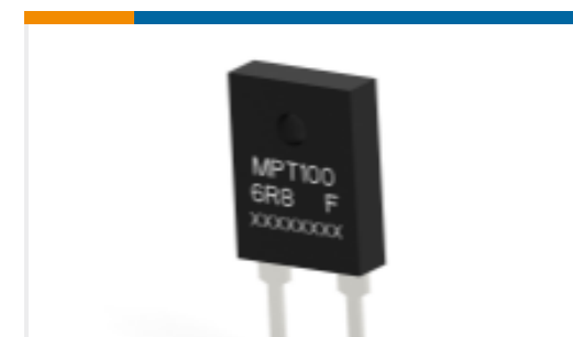
TE 产品编号2176429-7 MPT100 1R0 5%