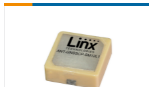
TE 产品编号ANT-GNSSCP-SM12L1 Antenna GNSS L1 12x12 SMT