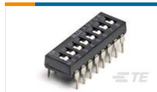
TE 产品编号1-1825059-7 ADF04ST04=DIP SWT,FLUSH,SMT-GW