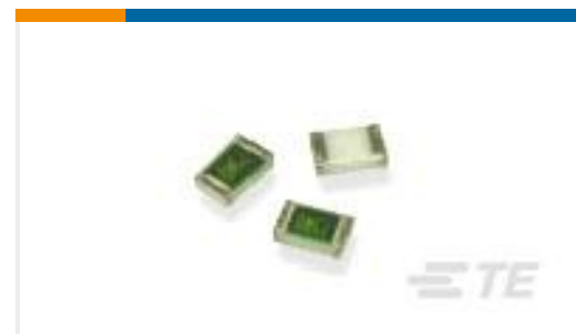
TE 产品编号1676225-2 RN 0805 1K1 0.1% 10PPM 1KRL