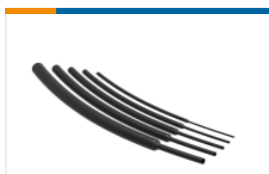
TE 产品编号5052942064 RNF-100-0 热缩管