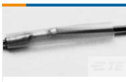
TE 产品编号CV25362001 RW-175-E-1/16-X-STK