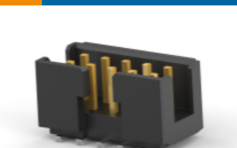
TE 产品编号1-2373376-0 10P,2MM,SHRD HDR,DRVT,SMD,0.1 AU,TB