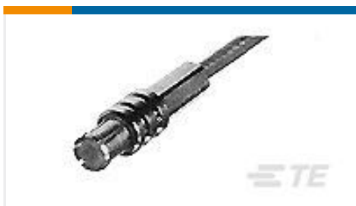
TE 产品编号1060875-2 MCX CABLE PLUG, CRIMP ATTACH