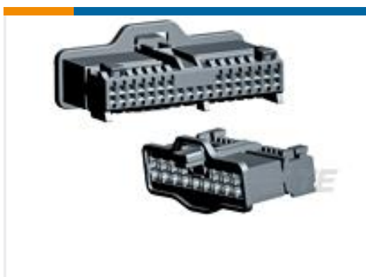
TE 产品编号2141576-3 32POS NANO MQS TL PLUG HOUSING, CODE C