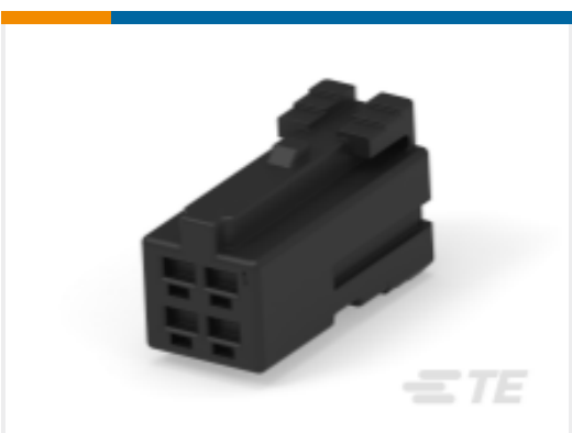
TE 产品编号2219501-2 060 4P PLUG ASSY