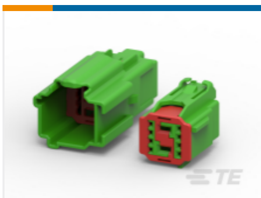
TE 产品编号2-1419158-2 GET .64 连接器系统, 连接器壳体