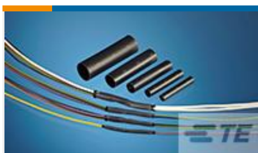
TE 产品编号CV34706001 QSZH-125-NR4-60MM