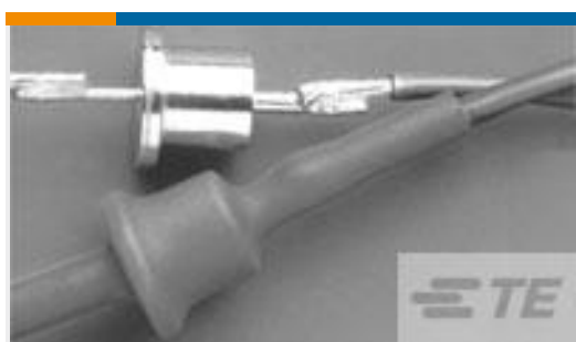
TE 产品编号5677676020 RNF-3000-24/8-2-70MM