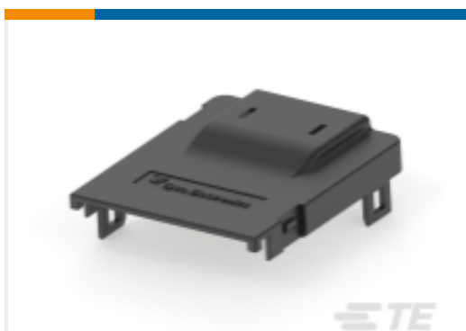
TE 产品编号1986186-1 Strain Relief,20 Posn,D3000 Dynamic, 2