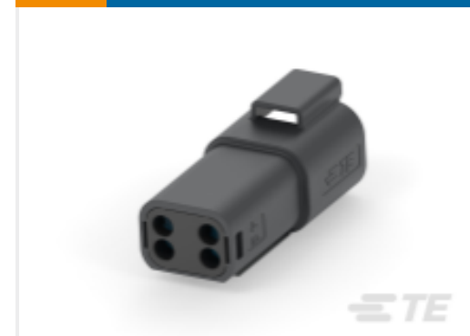
TE 产品编号1-2600030-0 4CCT BLACK RECEP W/LARGE SEAL