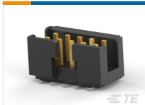
TE 产品编号1-2373376-0 10P,2MM,SHRD HDR,DRVVT,SMD,0.1 AU,TB